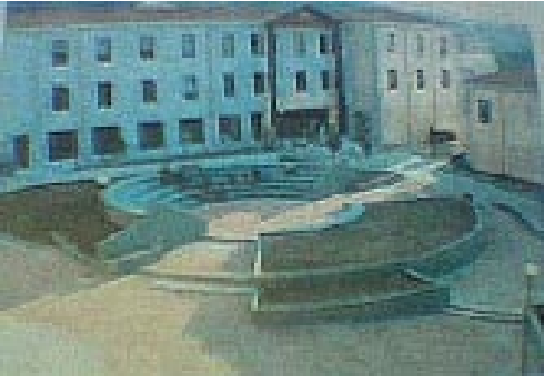
Εικ. 2. Τα νέα κτίρια στο Λόφο Πανεπιστημίου. Διακρίνεται το κτίριο του Τμήματος Επιστήμης της Θάλασσας (μπλε χρώμα). Στα αριστερά βρίσκονται η Φοιτητική Λέσχη και το Τμ. Γεωγραφίας.

Επιστήμης της Θάλασσας και Γεωγραφίας παρακολουθούν τα μαθήματά τους στις αμφιθεατρικού τύπου αίθουσες των νέων κτιριακών εγκαταστάσεων των Τμημάτων τους, τα οποία γειτονεύουν με τα κτίρια του Τμήματος Περιβάλλοντος και της Διοίκησης στο Λόφο Πανεπιστημίου. Κάθε Τμήμα έχει το δικό του κυλικείο, που έχει αέρα καφετέριας, ενώ στο κτίριο της Διοίκησης στεγάζεται και η Φοιτητική Μέριμνα, όπου δίδονται τα συγγράμματα όλων των Τμημάτων του Πανεπιστημίου που βρίσκονται στη Μυτιλήνη. Στον ίδιο χώρο από φέτος (Σεπτέμβριος 2004) λειτουργεί η νέα Φοιτητική Λέσχη, που εξυπηρετεί τους «θαμώνες» – φοιτητές,