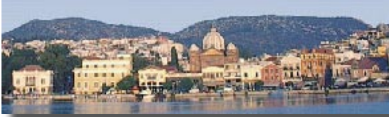
Εικ. 1. Η Μυτιλήνη!

Φαλτάκα Παναγιώτα Φοιτήτρια Τμήματος Περιβάλλοντος Πανεπιστήμιο Αιγαίου env01072@env.aegean.gr