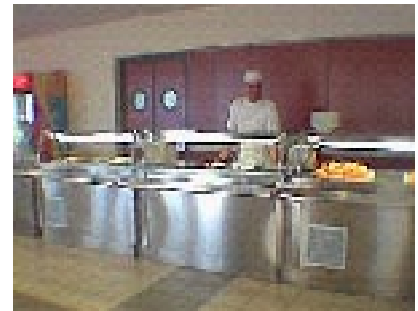
Εικ. 3. Άποψη της νέας Φοιτητικής Λέσχης στο Λόφο Πανεπιστημίου

καθηγητές, προσωπικό – του Λόφου, καθώς και όποιον επισκέπτη επιθυμεί γεύμα εκεί. Οι φοιτητές δικαιούνται πια 3 γεύματα (πρωινό, μεσημεριανό, δείπνο) επιδεικνύοντας επιτέλους μόνο το πάσο τους. Καθηγητές και προσωπικό τρώνε με 1 €, ενώ οι επισκέπτες με 3 €. Του χρόνου αναμένουμε το τέλος των εργασιών ανέγερσης των καινούριων εργαστηριακών εγκαταστάσεων δίπλα στο κτίριο του Τμήματος Περιβάλλοντος και την έναρξη νέων για την κατασκευή Φοιτητικής Εστίας που θα ανήκει στο Πανεπιστήμιο και δε θα είναι συμβεβλημένη με ξενοδοχεία, όπως τώρα. Μαζί με τη μεταφορά των Τμημάτων δημιουργήθηκε ειδικός χώρος parking και προστέθηκαν δρομολόγια λεωφορείων που μεταφέρουν τους φοιτητές πάνω στο Λόφο, καθώς και δυνατότητα προμήθειας Κάρτας Απεριορίστων Διαδρομών για φοιτητές με καταβολή 35 € .